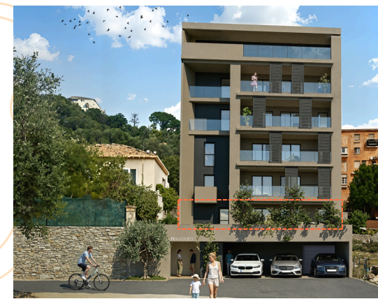
Lot n°01 - 1er étage